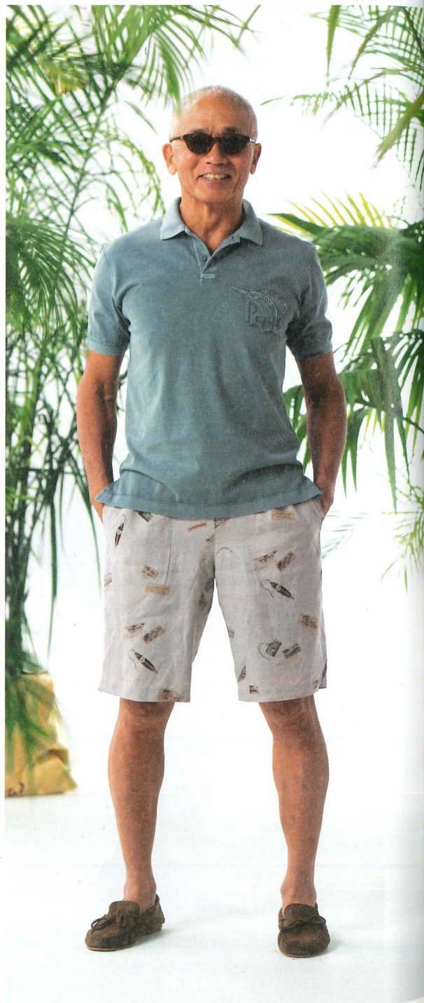
ポロシャツ:5月中旬 403UPL008 ⑤ S・M・L・LL ¥19,800(税別) 半パンツ:4月中旬(麻100%/SURF LABELプリント) 401FPS202 ⑤ M・L・LL ¥33,000(税別) サングラス 461ESG002 ① ¥22,000(税別) 靴(MADE IN ITALY) 486ESH006 ② 24.5~26.5cm ¥38,000(税別)