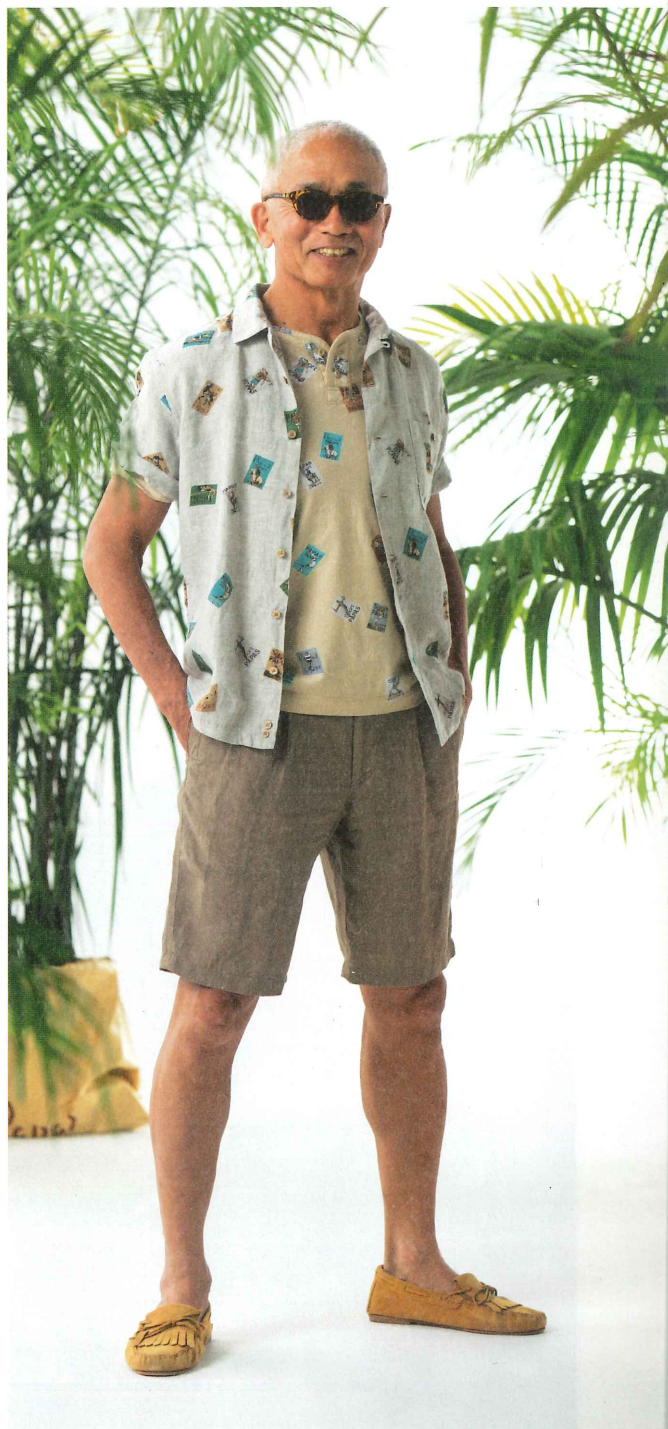
Tシャツ:4月中旬(OLYMPIC SPORTプリント) 403UTS006 ① S・M・L・LL ¥26,000(税別) プリントシャツ:4月下旬(麻100%/OLYMPIC SPORTプリント) 403FBP221 ⑦ S・M・L・LL ¥35,000(税別) 半パンツ:4月中旬(麻100%) 401FPS007 ① M・L・LL・XL ¥32,000(税別) サングラス 461ESG002 ③ ¥22,000(税別) 靴(MADE IN ITALY) 486ESH005 ③ 24.5~27cm ¥38,000(税別)