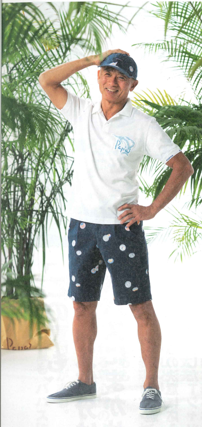
ポロシャツ:5月中旬 403UPL008 ① S・M・L・LL ¥19,800(税別) 半パンツ:4月上旬(綿麻ストレッチ/BOTTLE CAP BEARプリント) 401FPS201 ⑤ S・M・L・LL・XL・2X・3X ¥39,800(税別) 帽子:4月上旬 401EHT004 ⑤ M・L ¥16,000(税別) 靴 425ESH203 ⑦ 25.5・26.5・27.5cm ¥19,800(税別)