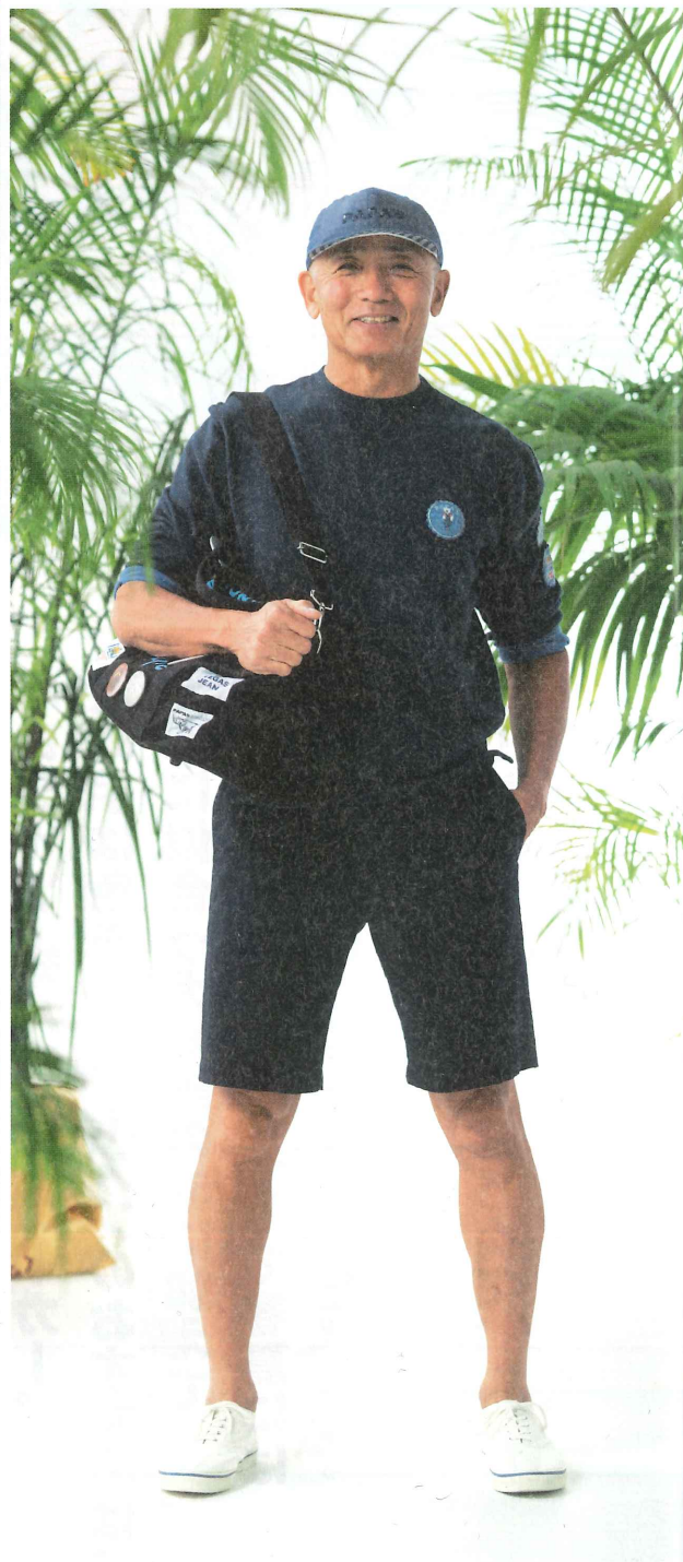
トレーナー:1月中旬 401UTR002 ④ S・M・L・LL ¥25,000(税別) 半パンツ:4月上旬(綿麻ストレッチ) 401FPS002 ⑥ S・M・L・LL・XL・2X・3X ¥24,000(税別) 帽子:5月中旬 401EHT015 ③ M・L ¥14,800(税別) バッグ 425EBG901 ③ ¥34,000(税別) 缶バッジ 464EAC011・015 ① 各¥500(税別) 靴:3月中旬 425ESH205 ① 24.5~27cm ¥23,000(税別)