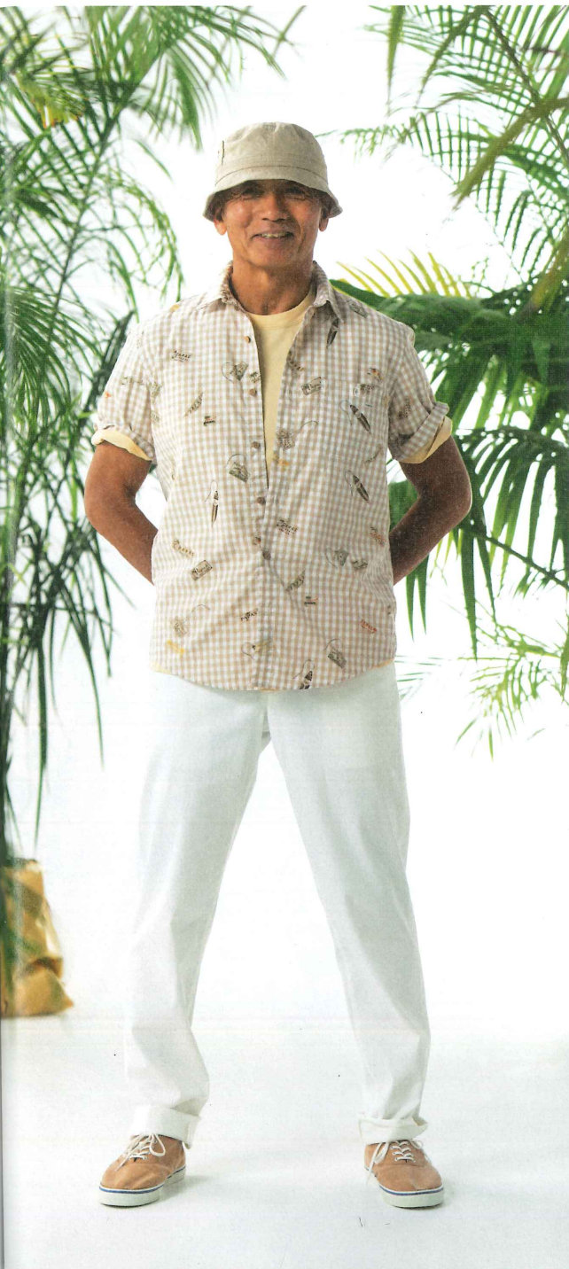
Tシャツ:5月中旬 403UTS015 ② S・M・L・LL ¥12,000(税別) プリントシャツ:4月中旬(ギンガム/SURF LABELプリント) 403FBP227 ① S・M・L・LL ¥33,000(税別) パンツ:4月上旬(綿麻ストレッチ) 401FP020 ① S・M・L・LL・XL・2X・3X ¥28,000(税別) 帽子:2月上旬 401EHT003 ② M・L ¥13,800(税別) 靴 425ESH203 ⑥ 25~27.5cm ¥19,800(税別)